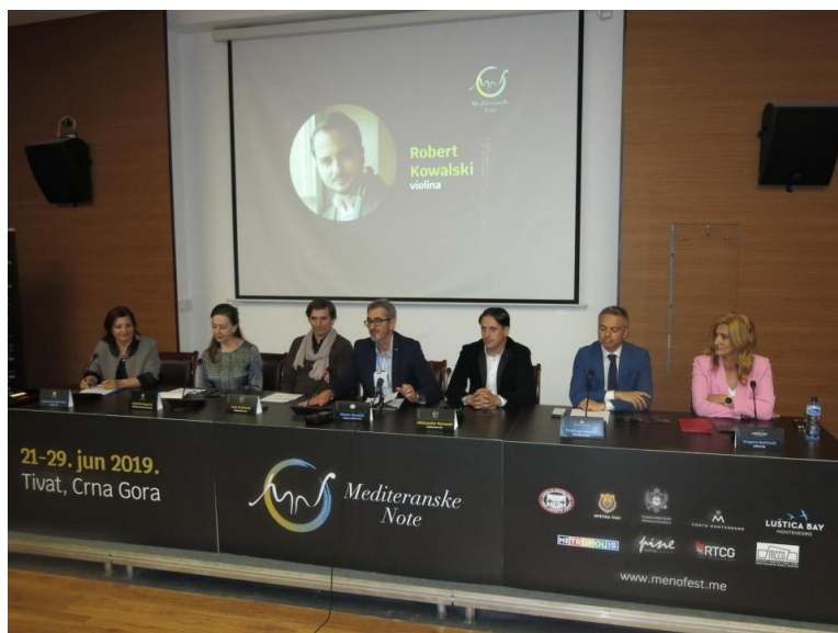
Predstavljanje programa festivala „Mediterranske note”

U autobusu se gospođa ljutito obraća putniku sa psom. Odmaknite vašeg psa dalje, osjećam kako mi